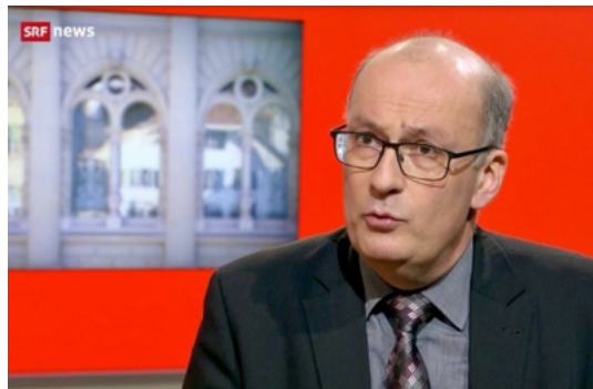
Der Präsident des Schweizer Bauernverbandes SBV, Markus Ritter, im Interview mit der SRF-Sendung «10 vor 10».

Der Präsident des Schweizer Bauernverbandes SBV, Markus Ritter verteidigt den «Plan Wahlen 2.0» der SVP in einem Interview mit dem Schweizer Fernsehen , «weil die Schweiz sehr viele Lebensmittel importiert, aktuell über 40 Prozent. Und bei diesem Vorstoss geht es vor allem darum, dass wir unsere Produktion erhalten.»