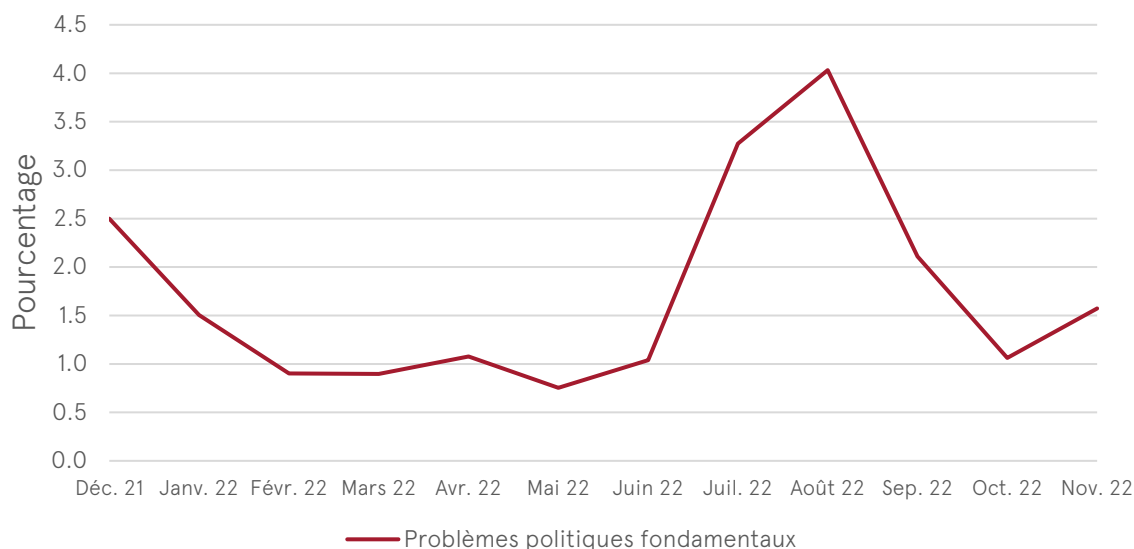
Figure 1: Pourcentage d'articles de journaux par mois

Légende : Proportion d'articles de journaux par mois sur le sujet « Problèmes politiques fondamentaux » en comparaison à l'ensemble des articles de journaux sur la politique nationale au cours d'un mois.