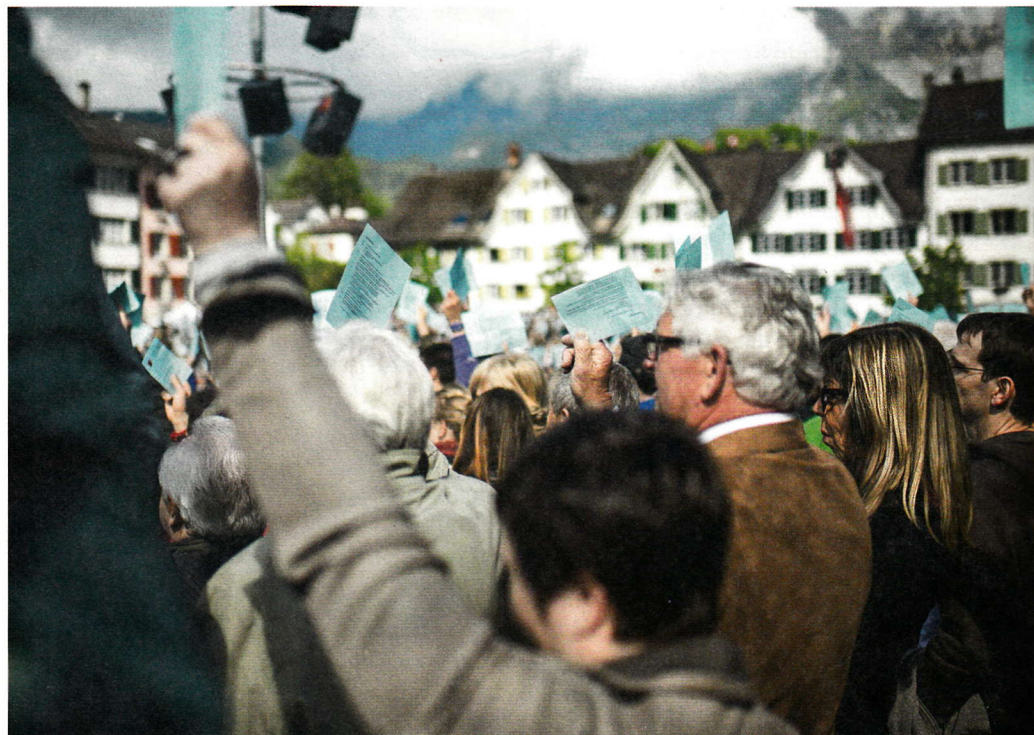
Sachliche Begründungen: Landsgemeinde in Glarus.

Eine erste, die Dissertation von Hans-Peter Schaub,* vergleicht die Demokratiequalität von Landsgemeinde- und Urnen-Entscheiden